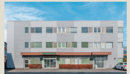
本社・静岡営業所